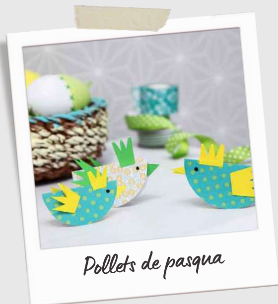
Pollets de pasqua

Envieu-nos fotografies del resultat i les compartirem en el proper número de la Xinxeta