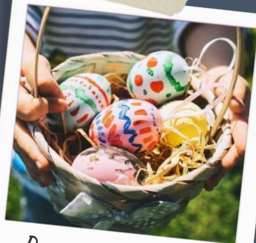
Decorar ous de pasqua

Per no tacar-nos massa i no fer malbé la pintura, podem passar per dins el pal de broxeta i fer-la servir per anar girant l'ou. A continuació, ja podem decorar amb els nostres colors preferits.