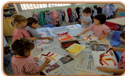
Hem pintat la tardor