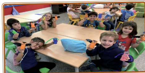
Hem fet titelles