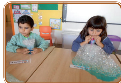
Hem fet bombolles