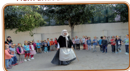
Hem ballat amb la Castanyera