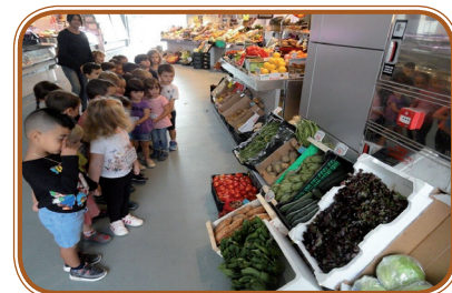
Hem anat al mercat