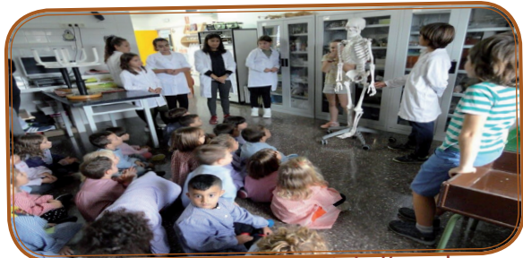
Hem anat al laboratori de l'escola